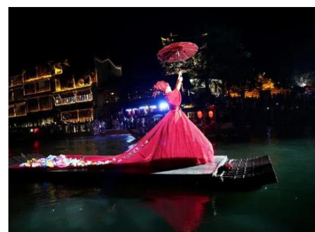
湘见·沱江艺术夜游船