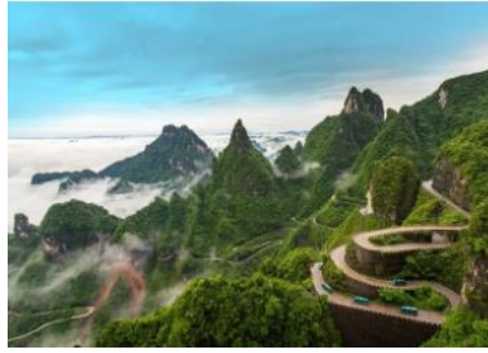
天门山国家森林公园