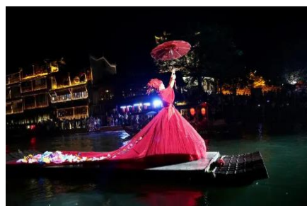
湘见·沱江艺术夜游船