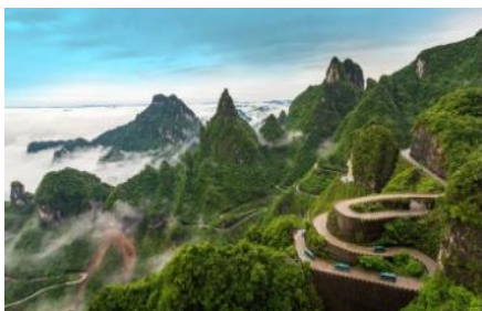
天门山国家森林公园